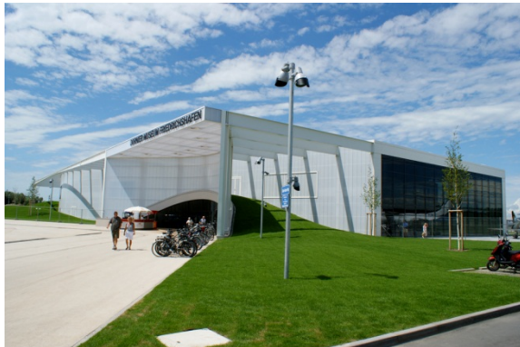
This weather would be a dream

Einer unserer interessantesten Programmpunkte versank im Regen. Unsere Hoffnung starben